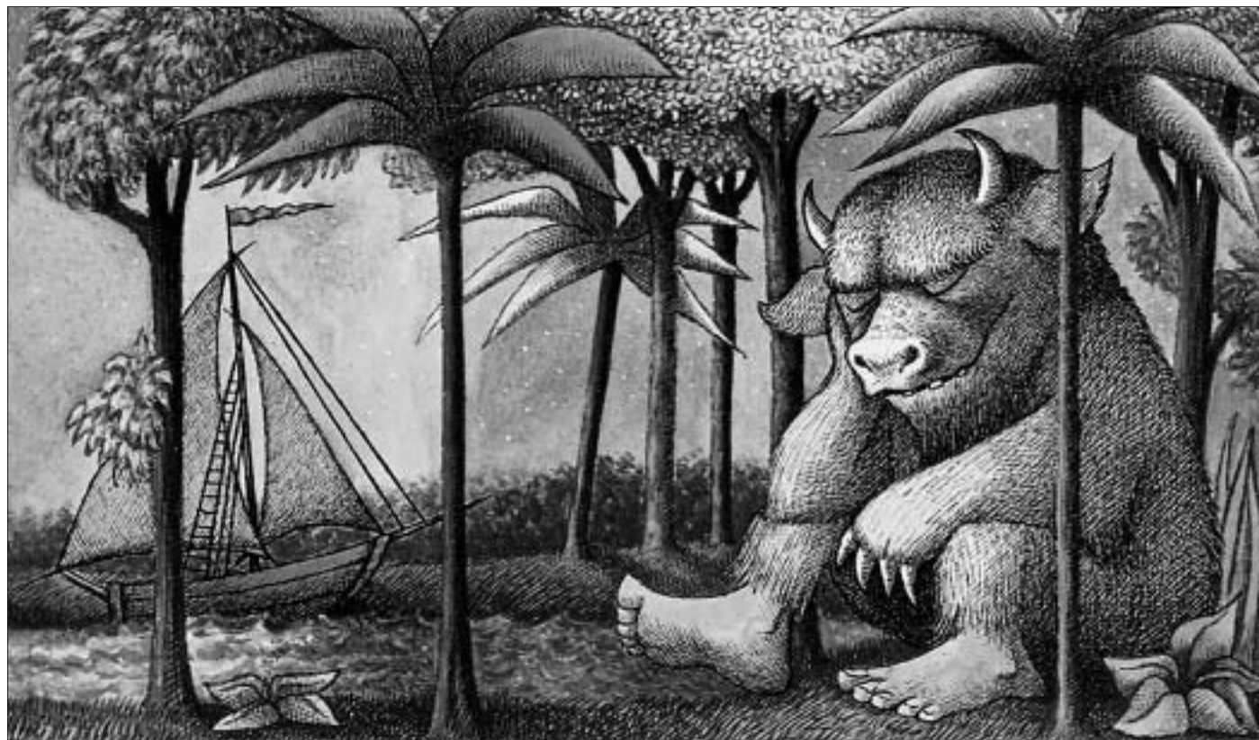
Liburuaren azaleko detaile bat.