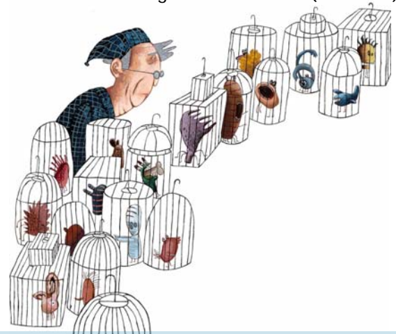
Ilustración por la obra "¿Dónde perdió Luna la risa?", editada por KALANDRAKA. En el ámbito artístico también realizó exposiciones individuales y colectivas de pintura y grabado, en galerías como Cuarta Pared (Madrid), Bacos y Visual Labora (Vigo), la muestra 'Novos Valores' (Pontevedra) y la Real Academia Gallega de Bellas Artes (A Coruña).

Licenciado en Bellas Artes por la Universidad de Vigo, en la especialidad de pintura. Destacan sus colaboraciones en proyectos de escenografía musical y de ilustración para el Instituto de Formación y Estudios Sociales. Entre otros galardones recibió, en 2001, el Premio Nacional de