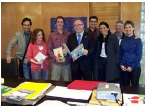
Reunión del jurado del III Premio Compostela y encuentro posterior con el alcalde de Santiago y la concejal de Educación

El alcalde de Santiago, Xosé A. Sánchez Bugallo, que presidió el fallo del jurado, destacó precisamente que se trata de una convocatoria "muy potente" por el elevado número de originales enviados desde países tan diversos. Los miembros del jurado resaltaron la "progresión continua" del certamen en sus primeras tres ediciones; también se mostraron "abrumados" por la cantidad "enorme" de obras recibidas y "satisfechos" de los acuerdos adoptados por unanimidad.