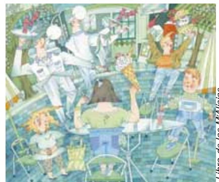
Libro de las M'Alicias