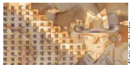
Al pie de la letra