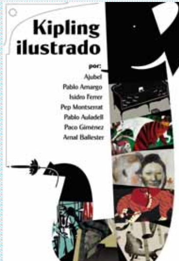
KIPLING ILUSTRADO R. Kipling / VV.AA. / 224 p. / 35€ Siete prestigiosos artistas recrean sus textos más fascinantes.