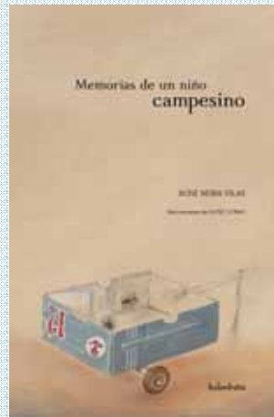
MEMORIAS DE UN NIÑO CAMPESINO X. Neira Vilas / X. Cobas / 128 p. / 18€ 50 años de la publicación de un texto memorable.