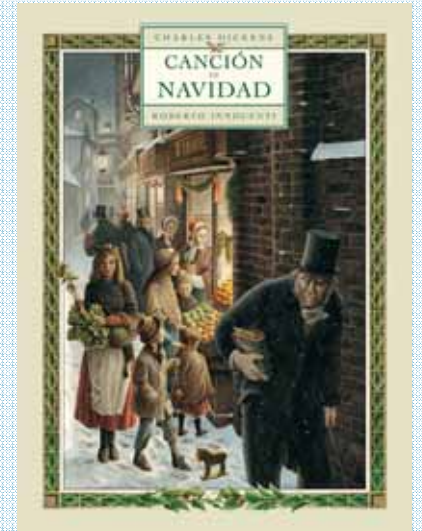
CANCIÓN DE NAVIDAD C. Dickens / R. Innocenti / 156 p. / 25€ Elegante edición e ilustraciones magistrales en el 200 aniversario del autor.