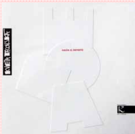
HASTA EL INFINITO K. Pacovská / 128 p. / 40€ Letras y números de papel, elevados a la categoría de Arte.