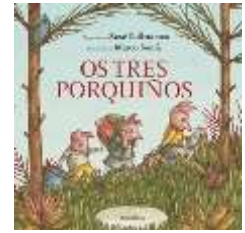
OS TRES PORQUÍÑOS X. Ballesteros - M. Somà Soprou e a soprou, pero a casiña de pedra...