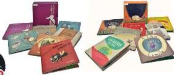
MINILIBROS IMPERDIBLES, vol. 1 e 2 V.V.AA. Sete contos en miniatura en cada caixiña.