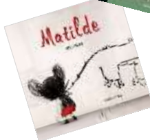
MATILDE Sozapato Algo de cor nun mundo gris, con xente gris...