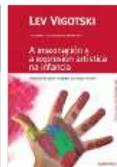
BIBLIOTECA DE PEDAGOXÍA A cidade dos nenos Cando os nenos diñ BASTA! Francesco Tonucci Educación para un mundo novo María Montessori A imaxinación e expresión artística na infancia Lev Vigotski