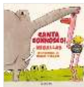
CANTA CONNOSCO! Migallas - Ó. Villán - J.M. Sagüillo 20 anos dunhas cancións que volven con ilustracións e videoclips.