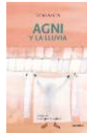
AGNI E A CHUVIA D. Sales - E. Flores A vida dun neno pobre en Bombai.