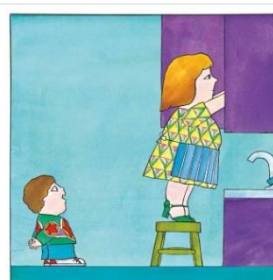
-Ola, mamá -dixo Bernardo.