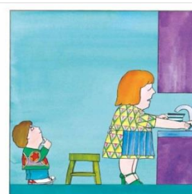
-Agora non, Bernardo -dixo súa nai.