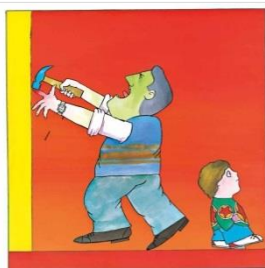
-Ara no, Bernat -va dir el pare.