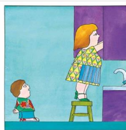
-Hola, mare -va dir en Bernat.