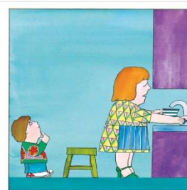
-Ara no, Bernat -va dir la mare.