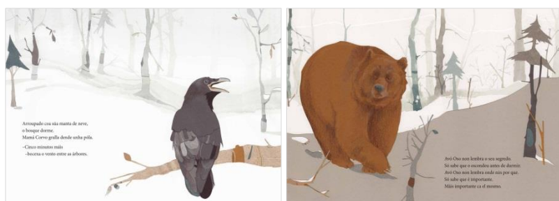
[A ilustración desta obra contou cunha axuda do Institut Ramon Llull]

Zuzanna Celej sorprende cunhas chamativas ilustracións a base de lapis de cor, acuarela e apliques de papel de diferentes texturas. O resultado é unha atmosfera máxica e serena onde os espazos e os protagonistas son representados con sutil expresividade e realismo. Con diversidade de planos e encadres que acentúan o dinamismo do relato, son imaxes cheas de contrastes de luz e de sombras, e nas que o colorido vai gañando presenza a medida que se desvela o segredo de Avó Oso.