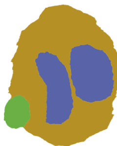
Pero Papá Azul y Mamá Azul dijeron: «¡Tú no eres nuestro Pequeño Azul. Tú eres verde!»