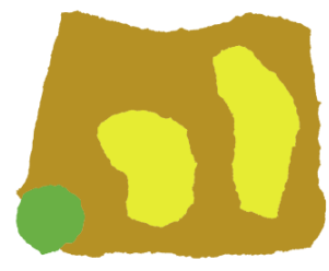
Papá Amarillo y Mamá Amarillo dijeron: «¡Tú no eres nuestro Pequeño Amarillo. Tú eres verde!»