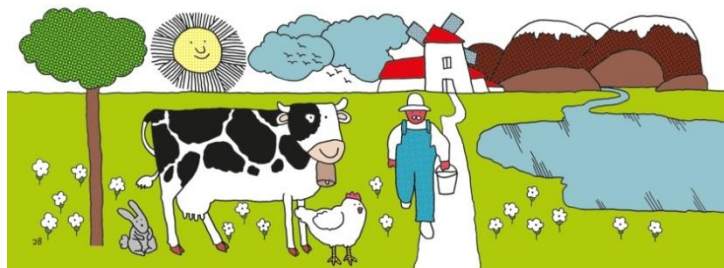
Esta obra ha recibido una ayuda a la edición del Ministerio de Educación, Cultura y Deporte

Las sencillas ilustraciones de Miguel Ángel Pacheco acompañan las composiciones con trazos firmes y de línea clara, figuras planas y redondeadas, que rellena con punteados y rayas para dotarlas de profundidad y perspectiva.