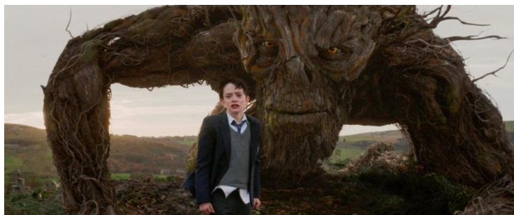
[Fotograma da película “Un monstro viene a verme”, dirixida por Juan Antonio Bayona]

Unha narración sinxela pero profunda, con moitas capas, que sacude e non deixa indiferente, invitando á reflexión.