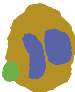
Pero Papá Azul y Mamá Azul dijeron: «Tú no eres nuestro Pequeño Azul. Tú eres verde!»