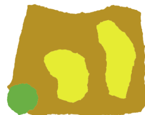
Papá Amarillo y Mamá Amarillo dijeron: «Tú no eres nuestro Pequeño Amarillo. Tú eres verde!»