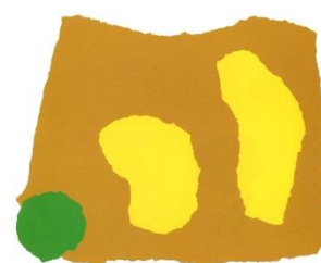
E' Mamá Amarelo e Papá Amarelo dixeron: "Ti non es o noso Pequeno Amarelo, ti es verde!"