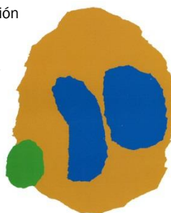
Pero Mamá Azul e Papá Azul dixeron: "Ti non es o noso Pequeno Azul, ti es verde!"

Leo Lionni creceu nun ambiente artístico -a súa nai foi cantante de ópera, e o seu tío Piet, un afeccionado á pintura- e dende moi novo soubo que ese sería o seu destino. En cambio, a súa formación non foi artística, xa que se doutorou en Economía. En 1931 instalouse en Milán e entrou en contacto co deseño gráfico. Cando se trasladou a América en 1939, traballou nunha axencia de publicidade de Filadelfia, na Corporación Olivetti e na revista Fortune. Tamén medrou a súa reputación como artista e os seus cadros exhibíanse nas mellores galerías, dende Estados Unidos a Xapón. Como el mesmo dixo: "Dalgún modo, nalgún lugar, a arte expresa sempre os sentimentos da infancia". O seu primeiro libro para nenos non chegou ata 1959, e xurdiu case por casualidade: durante unha viaxe en tren ocochéuselle entreter os seus netos cun conto feito a base de anacos de papel de seda. Así naceu "Pequeno Azul e Pequeno Amarelo", ao que lle seguiron máis de 40 obras aclamadas en todo o mundo pola crítica especializada. Polos seus méritos como escultor, deseñador, pintor e ilustrador, recibiu en 1984 a Medalla de Ouro do Instituto Americano de Artes Gráficas.